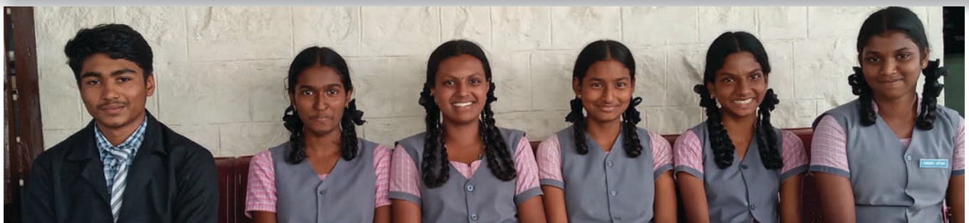
Ci-dessus une partie des enfants de Valparai